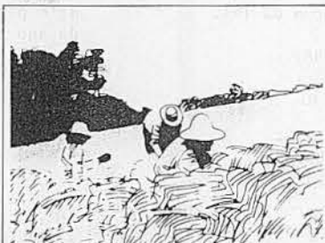
SENAR Serviço Nacional de Formação Profissional Rural