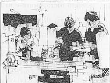
SNFMO Sistema Nacional de Formação de Mão-de-Obra.

“ Mas é sobretudo no campo social, acima de tudo nos investimentos feitos no homem e para seu bem-estar, que verdadeiramente realizaremos a independência nacional. Por assim julgar, desejo deixar bem claro que o pensamento e a ação do meu governo não se realizam só nas construções, nas obras e nos edifícios, nas fábricas e nas máquinas, nas usinas e nos geradores. Por mais necessários que sejam os bens materiais, precisamos não esquecer: tudo isso existe para o homem. E se não contribuir para a sua felicidade será perda.