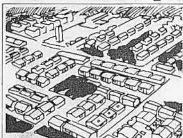
PROSINDI Programa de Habitação para o Trabalhador Sindicalizado.