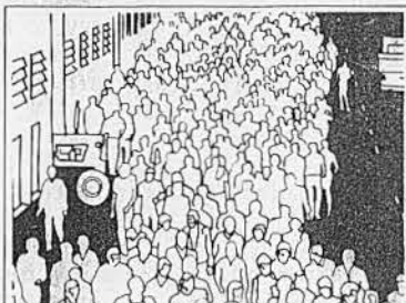
SINE Sistema Nacional de Emprego.