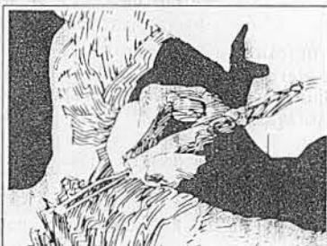
PNDA Programa Nacional de Desenvolvimento do Artesanato.