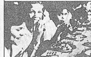
PROGRAMA NACIONAL DE MERENDA ESCOLAR Distribuição de merenda escolar.