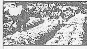
PROJETO DE COMERCIALIZAÇÃO DE ALIMENTOS BÁSICOS EM ÁREAS DE BAIXA RENDA - NORDESTE Garantia do mercado institucional aos pequenos produtores.