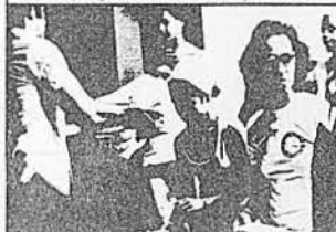
PROGRAMA DE COMPLEMENTAÇÃO ALIMENTAR - PCA Distribuição, nas unidades de saúde assistenciais, de alimentos para gestantes, nutrízes e crianças até 3 anos.