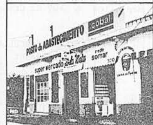
ABASTECIMENTO - POPULAÇÕES DE BAIXA RENDA