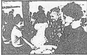
PROGRAMA DE NUTRIÇÃO EM SAÚDE - PNS Suplementação alimentar a gestantes, nutrízes e crianças até 7 anos.