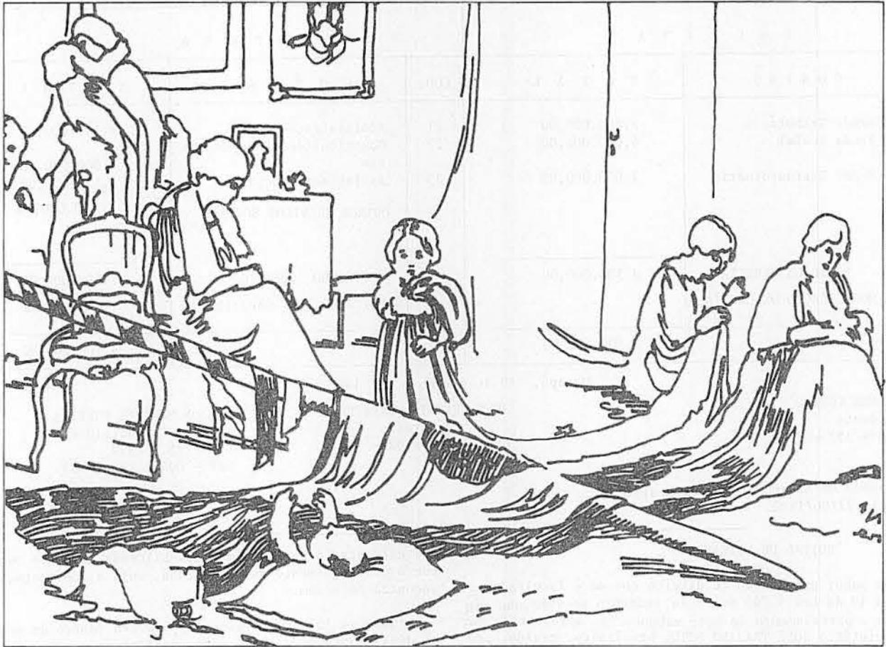
"A Pátria" - Óleo de Pedro Bruno. Pinacoteca do Museu da República. Acervo do Museu Histórico Nacional.

A Bandeira é um dos nossos símbolos nacionais. Assim como o hino, o selo e as armas, ela também representa nossa pátria. O amor que temos pela nossa Bandeira é uma forma de demonstrar o grande amor que temos pelo Brasil. Hastear, respeitar e reverenciar a Bandeira não significa apenas cultuar o símbolo mas testemunhar a permanente exaltação da Pátria. A Bandeira pode ser hasteada e arriada a qualquer hora do dia ou da noite. Normalmente faz-se o hasteamento às 8 horas e o arriamento às 18 horas. Durante a noite a Bandeira deve estar devidamente iluminada. Todos os brasileiros devem procurar informações sobre a Bandeira, sua criação, história e grandiosidade.